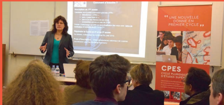
Salle comble pour les Journée Portes Ouvertes du CPES (Lycée Henri IV, 23 janvier)

Dans le cadre prestigieux du Collège de France, les 76 premiers diplômés du CPES ont célébré avec leurs proches et leurs enseignants la réussite de la première promotion. Ce fut l'occasion pour eux de souligner «la vraie diversité du CPES», la qualité des divers enseignements reçus et la chance «inouïe» d'avoir pu participer à la naissance et à l'évolution de ce premier cycle innovant. Toutes nos félicitations à eux et tous nos vœux de réussite pour la suite !