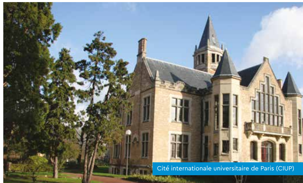
Cité internationale universitaire de Paris (CIUP)

Le montant du dépôt de garantie est limité à un mois de loyer hors charges s'il s'agit d'une location vide (deux mois en location meublée). Il s'agit d'un dépôt d'argent qui vous est rendu dans un délai maximum de 2 mois après vérification de l'état du logement et de la remise des clés. Le propriétaire est autorisé à retirer de cette somme les montants nécessaires à la remise en l'état en cas de dommages et sur justificatifs.